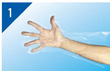
ケミカルグローブを付けます。