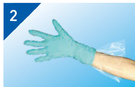
用途に応じたアウターグローブを 上に重ねて付けます。